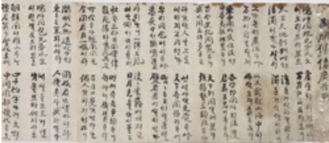
<그림 4> 단연상채광고가

전해지는 자료 중에는 국채보상운동의 초기 운동을 장려하기 위한 광고가 있어 주목된다. 1907년 3월에 작성한 <斷煙償債廣告歌>는 국채보상운동의 취지와 모금이 필요한 이유 등을 1,485자의 국한문 혼용으로 지은 가사이다. 52)