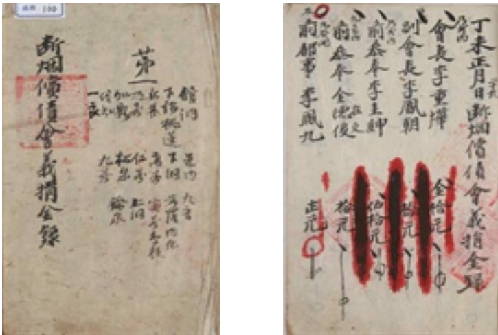
<그림 5> 단연상채회의연금록(제1)의 표지, 권수 부분