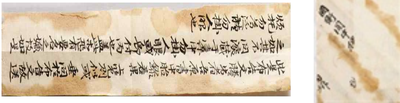
〈그림 2〉 〈포고천하문〉을 동봉한 별지(좌) 피봉(우)

밑에 ‘開塚’이라는 용어를 주로 쓰지만 ‘獨塚’이라 되어 있다. 바꾸어 말하면 “다른 사람은 개봉하지 말라”는 뜻으로, 중요한 문서였음이 짐작된다.