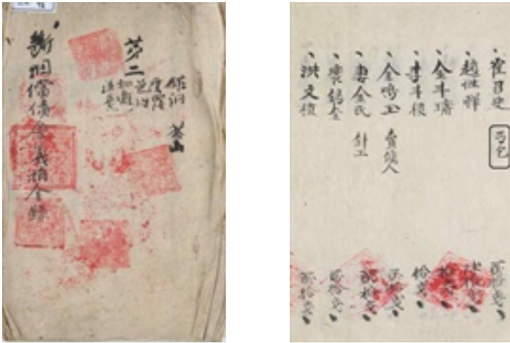
<그림 6> 단연상채회의연금록(제2)의 표지, 결인 표기 부분

운동에 참여하여 도움을 주려고 했던 중요한 실물 증거 기록이다. 책의 끝에 수록된 의연금의 도합은 합 308원 87전 중 1원을 상무소에 제출하여 실제로는 307원 87전이 있다고 하였다. 60)