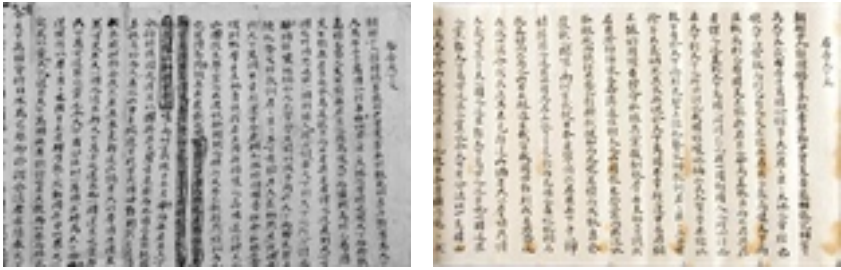
<그림 1> <포고천하본>의 수정본(좌)과 완성본(우)

수정본과 완성본을 비교해보면, 발의자 순서, 표기 수정, 문장 삭제 등에 있어 완성본에 반영되어 있는 것을 확인할 수 있다.