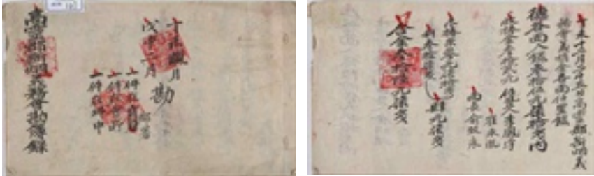
<그림 7> 『단연의무회 감부록』